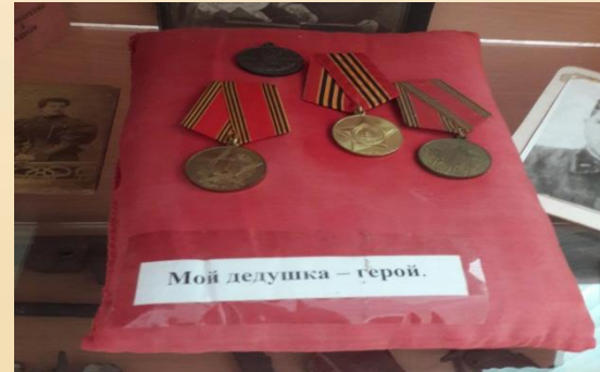
Награды ВОВ, переданные в фонд музея