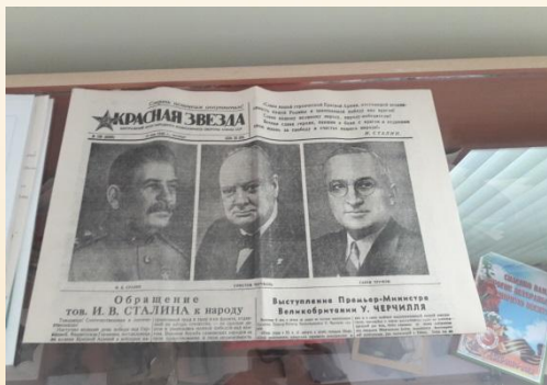
Газета – подлинник от 24 мая 1945