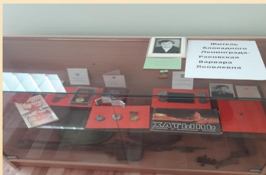
Награды ВОВ, переданные в фонд музея