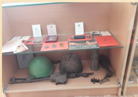
Остатки найденного оружия