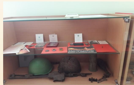
Документы, фотографии и остатки оружия времен ВОВ