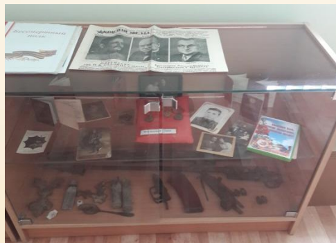
Остатки найденного оружия